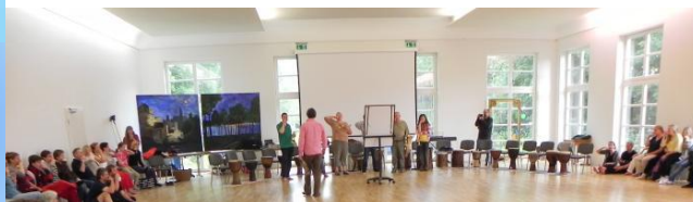
Seminarraum im Schloss

Würdigung des Humboldt-Hauses: Das Humboldt-Haus am Bodensee und die Focusing-Sommerschule waren jahrelang eine untrennbare Einheit. Viele Sommerschul-Teilnehmer*innen haben an diesem Ort jahrelang wesentliche