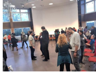
Impression der 1. Focusing-Impuls-Konferenz 2020

Die Einladung geht an Alle - herzlich willkommen sind Interessent*innen, die Focusing kennenlernen wollen, alle unsere Focusing-Freund*innen im DFI und ebenso Focusing-Kolleg*innen aus anderen Focusing-Instituten.