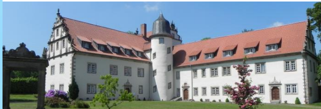
Das Schloss Buchenau

Erfreulicherweise haben wir in kurzer Zeit viele unterstützende Rückmeldungen von Teilnehmer*innen für diese Entscheidung bekommen.