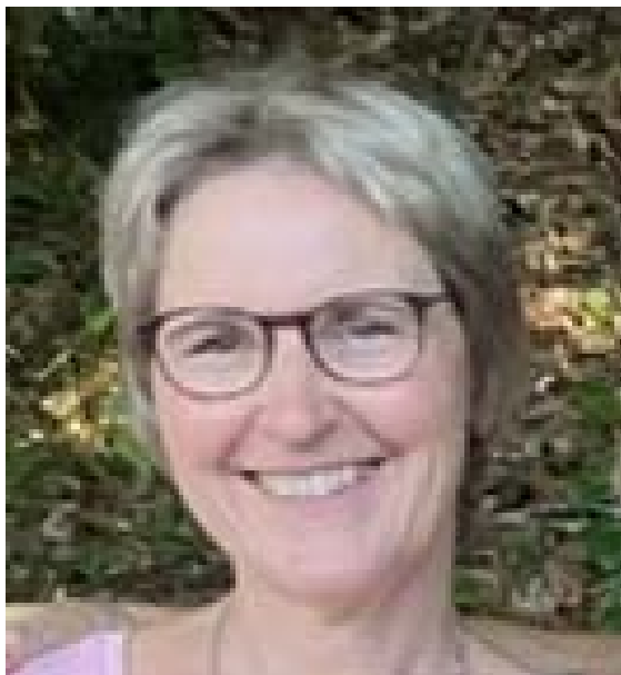
Charlotte Rutz zu